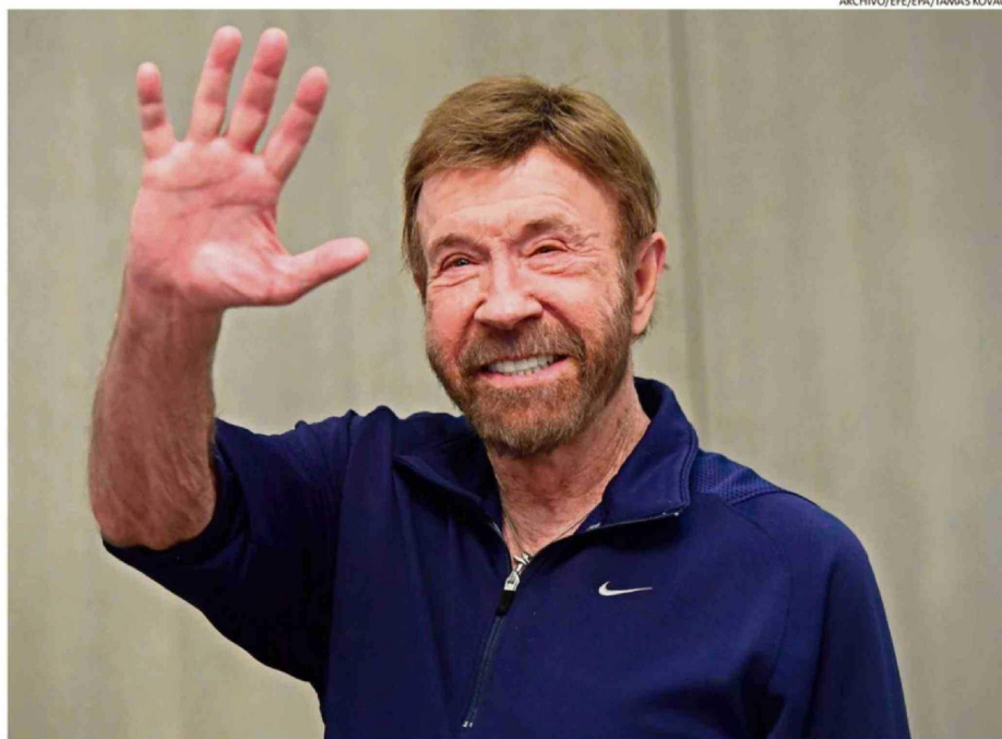
EL ACTOR FUE INTERNADO REPENTINAMENTE EN UN CENTRO MÉDICO EN HAWAÍ. EL 10 DE MARZO HABÍA CELEBRADO SU CUMPLEAÑOS.

"Probé gimnasia y fútbol americano en la preparatoria North Torrance", le con-