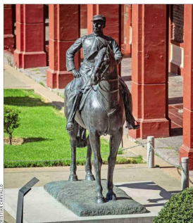
En el patio del Museo Histórico y Militar se encuentra actualmente el general Baquedano.

Con todo, según se explicó ayer en el concejo de Providencia, se debe revisar y rectificar, en el caso de que sea necesario, el sistema de anclaje de la escultura que quedó instalado en el plinto; también se tiene que medir la calidad del hormigón de este.