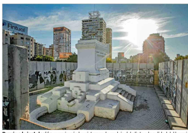
Previo a la instalación se revisarán los sistemas de anclaje del plinto y la calidad del hormigón, y se rectificarán en caso de ser necesario.

En cuanto al traslado, Baquedano se retirará desde el museo en un camión grúa de 15 toneladas, y ya en el lugar que ahora es una explanada—, se utilizará un camión telescópico de 60 toneladas para izarlo e instalarlo nuevamente en el plinto.