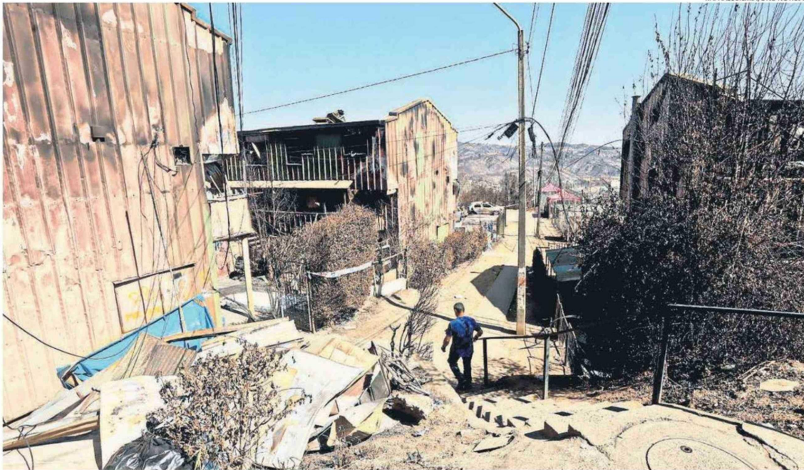
EL DOLOR DE VER DESTRUIDOS SUS ESFUERZOS DE AÑOS Y LA INCERTIDUMBRE SOBRE LO QUE VIENE HA GENERADO UN DESGASTE PSICOLÓGICO EN PERSONAS MAYORES.