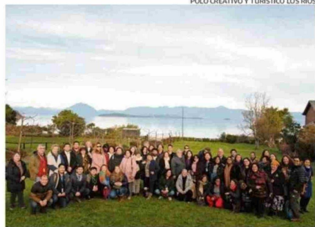
LA INICIATIVA FUE FINANCIADA POR EL GOBIERNO REGIONAL.

Como parte de la iniciativa financiada por el Gobierno Regional es que se trabajó con emprendedores que no han tenido la posibilidad de acceder al mercado. Con ellos hubo capa-