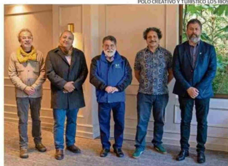
AUTORIDADES DE LOS RÍOS Y LA UACH EN EL CIERRE DEL PROYECTO.

citaciones y procesos de transferencia tecnológica para perfilar de mejor manera sus productos y servicios; integrándolos además a ruedas de negocios de Fluvial.