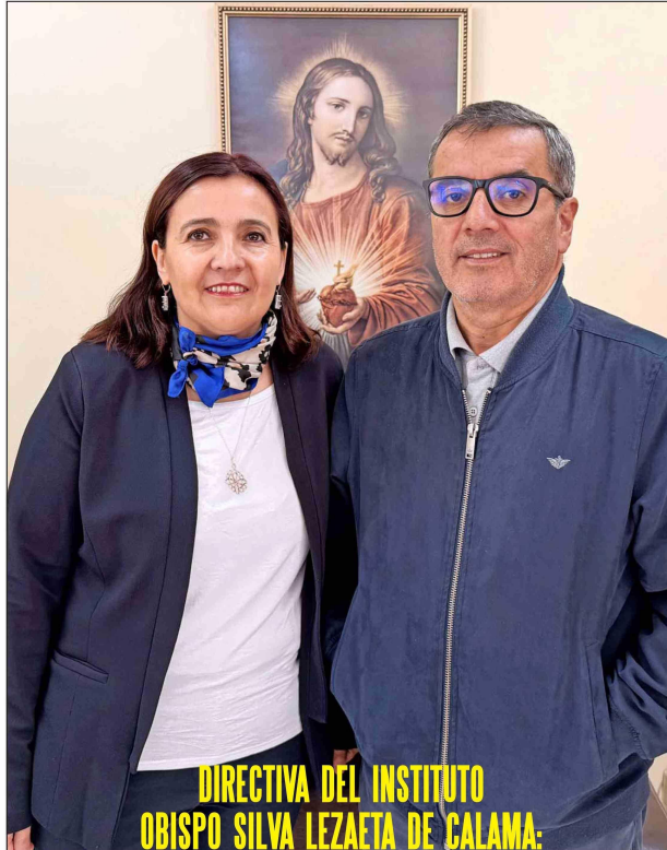
DIRECTIVA DEL INSTITUTO OBISPO SILVA LEZAETA DE CALAMA: