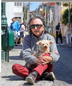
LAUTARO TRIVIÑO: EL ESCRIBA DEL DESVALIJAMIENTO DE VALPARAÍSO PÁGINA 6