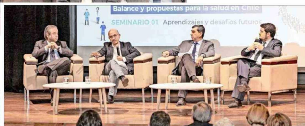
Los panelistas durante el encuentro "Pensando las próximas dos décadas del GES".