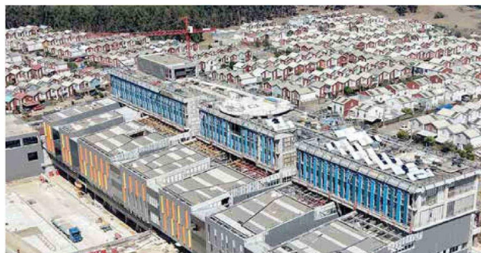
El proyecto, además, incorpora estándares de alto nivel, como certificación de edificio sustentable, aislación sísmica en su estructura principal y autonomía operativa de hasta 72 horas.

el nuevo hospital representa una de las inversiones públicas más relevantes en salud para la región, con un monto total de UF 2.568.510, que considera infraestructura, equipamiento y mobiliario. El recinto alcanzará una superficie de 39.335 metros cuadrados, equivalente a quince veces el tamaño del actual establecimiento, permitiendo ampliar sig-