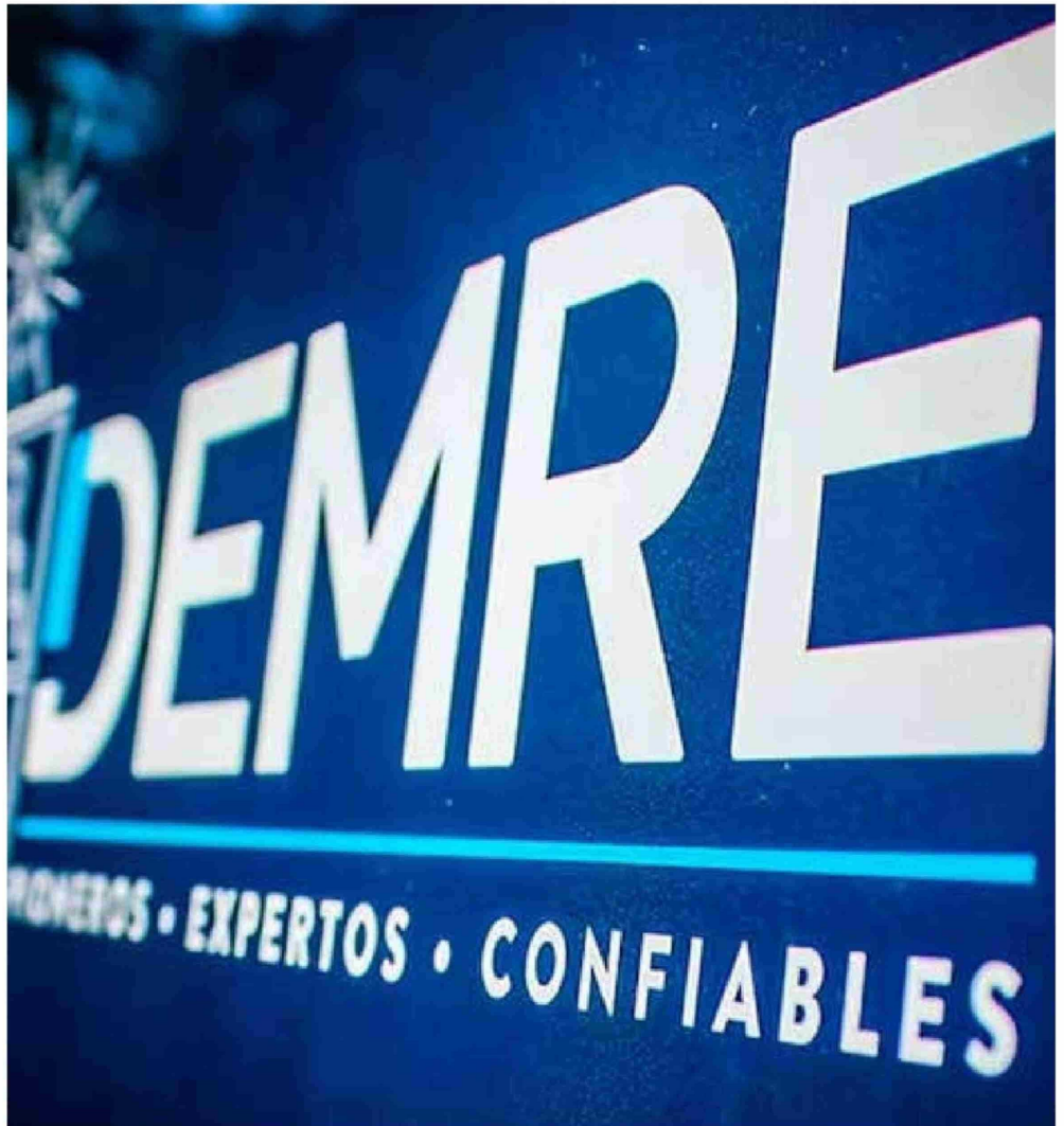
► Por 5 horas y 20 minutos un erróneo mensaje les apareció a personas que este lunes postularon a alguna carrera pedagógica.