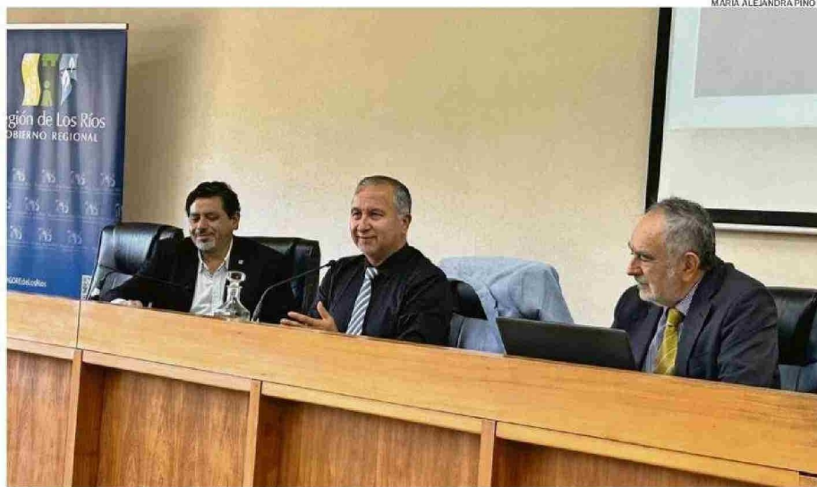
PANEL DE LA AGRUPACIÓN DE UNIVERSIDADES REGIONALES FUE PARTE AYER DEL ENCUENTRO DE CONSEJEROS REGIONALES.