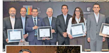
Grupo de empresas ganadoras del Sello de Distinción: Universidad Alberto Hurtado, OCG Chile, Grupo Guante-Gacal y Statkraft Chile.