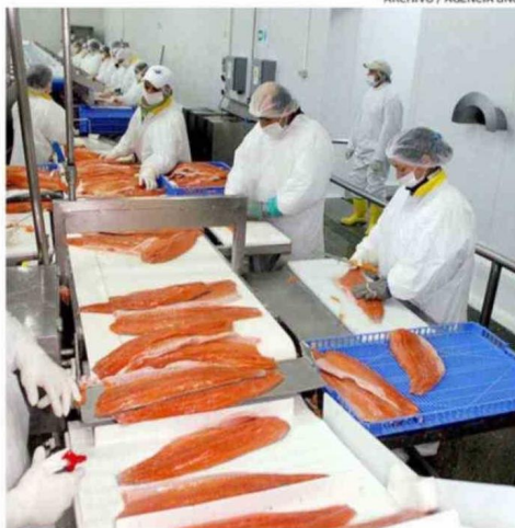
SE BUSCA REACTIVAR LA COMPETITIVIDAD DEL SECTOR SALMONICULTOR.