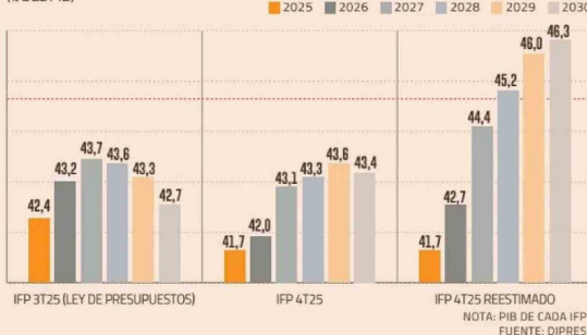
DEUDA BRUTA Y LA TRAYECTORIA REESTIMADA (% DEL PIB)

La Dipres explicó que realizó una auditoría de consistencia entre las