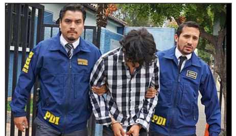
El imputado saliendo del cuartel de la PDI en San Felipe.

do y que el Estado repare lo que hizo con Cristian, de manera tal de que efectivamente la familia pueda ser resarcida de este perjuicio que sufrió.