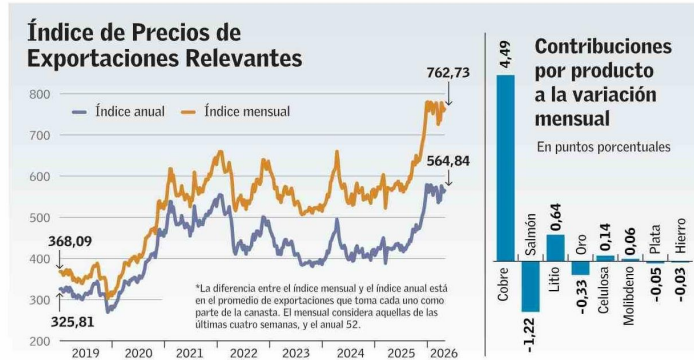
Fuente: Centro de Estudios Financieros, ESE Business School de la U. de los Andes, en base a datos del Banco Central.