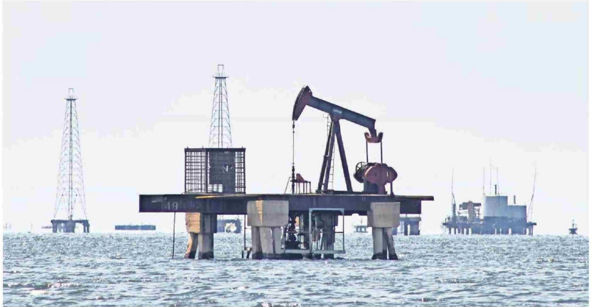
Plataforma petrolífera abandonada en Venezuela. No sólo este recurso sería el que necesita Estados Unidos.

El tercer foco relevante se encuentra en las implicancias institucionales. Muchos de los análisis que han emergido en estos días se han enfocado en la obviedad: que la operación contravenga principios básicos del derecho internacional. Y esto es, en estricto rigor, cierto. Obviamente, el punto al que se apela en esta vertiente de análisis es que si un estado puede justificar la captura de un líder extranjero alegando narcotráfico, o corrupción, o crímenes transnacionales sin respaldo multilateral, la línea entre persecución legal y guerra política se desvanece. El riesgo es que otros actores ocupen el mismo raciocinio para justificar acciones similares, o que Estados Unidos pueda realizar operaciones análogas en contra de otros actores.