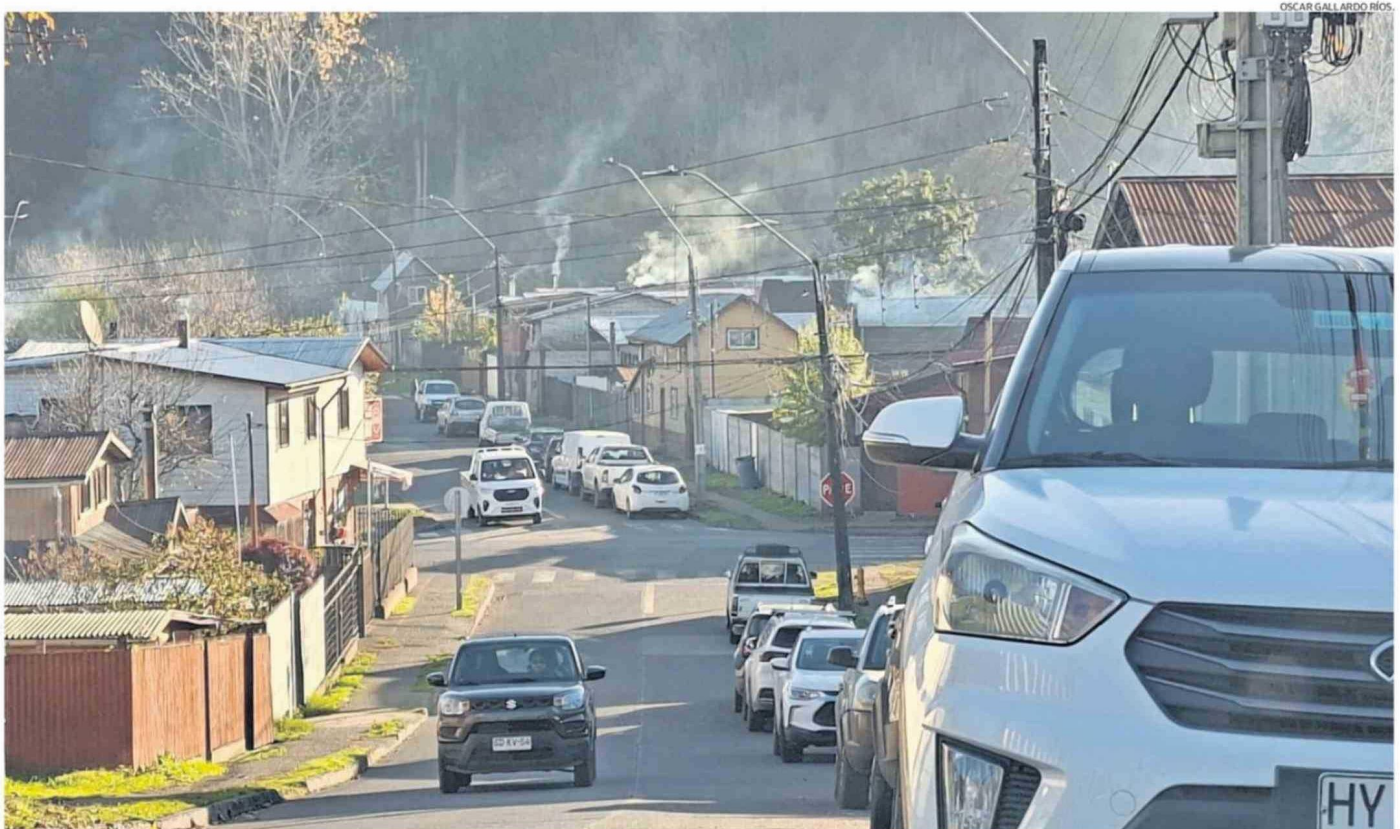
LA SEREMI DEL MEDIO AMBIENTE CONFIRMÓ QUE EN LAS ÚLTIMAS SEMANAS SE HAN REGISTRADO AL MENOS CUATRO JORNADAS EQUIVALENTES A PREEMERGENCIA AMBIENTAL EN LA COMUNA DE LA UNIÓN.

Seremi del Medio Ambiente confirmó que Río Bueno, Paillaco, Panguipulli, Mariquina y Los Lagos contarán con herramienta para detectar episodios de alta concentración de material particulado fino.