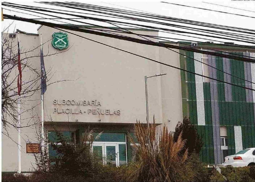
"SUBCOMISARÍA ESTÁ HACE 7 AÑOS: POR AHORA NO ESTÁ EN PROYECTO ASCENDERLA A COMISARÍA": DICE SEREMI DE SEGURIDAD PÚBLICA.

No obstante, en 2024 hubo 126 denuncias en Curauma-Placilla, con alza