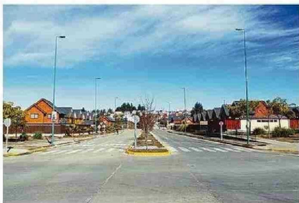
EN CURAUMA TEMEN POR PORTONAZOS, EMBOSCADAS Y ASALTOS.

Robos de vehículos, en lugar no habitado, con intimidación y violencia presentan un alza este año. A hoy van 368 casos en total (5,4%) entre robos, lesiones y hurtos respecto a igual lapso en 2024. Vecinos y locatarios piden más seguridad.