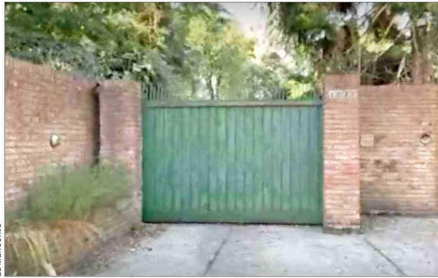
En la foto, una de las direcciones donde se fue a buscar al exfrentista.

Mientras, la PDI alista su intervención para repatriar al requerido que la policía argentina intentó ubicar en cuatro locaciones, sin éxito. Ayer, su defensa confirmó que no se entregaría.