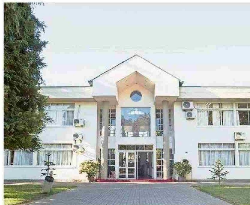
La sede de la universidad en Chillán.

"Nuestra universidad acoge el informe del órgano contralor con plena responsabilidad, reconociendo la necesidad de mejorar procedimientos y con total disposición a adoptar las medidas indicadas. Sin perjuicio de ello, creemos necesario precisar que, gracias a la implementación de un plan de sustentabilidad, la institución está en mejores condiciones financieras que en el periodo citado",