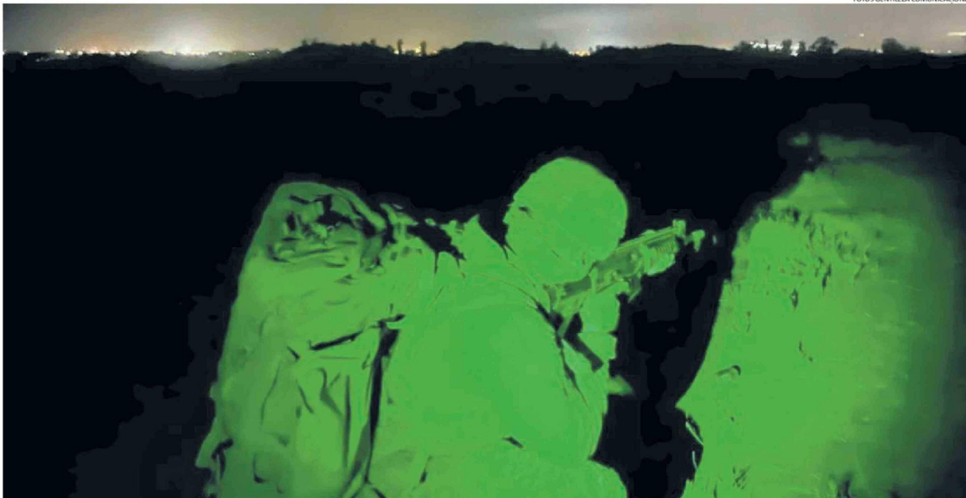
LOS INTEGRANTES DE LA BRIGADA REALIZARON PRÁCTICAS CON VISORES NOCTURNOS, TIRO DE COMBATE, NAVEGACIÓN TERRESTRE, DESPLAZAMIENTOS TÁCTICOS Y TÉCNICAS DE COMBATE CERCANO. Ç