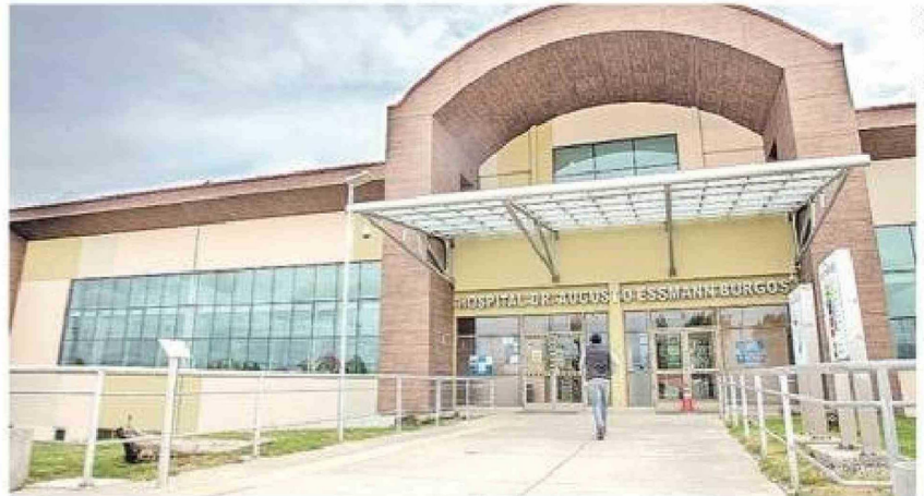
Hospital Augusto Essmann.