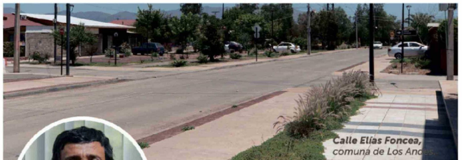
Calle Elías Foncea, comuna de Los Andes