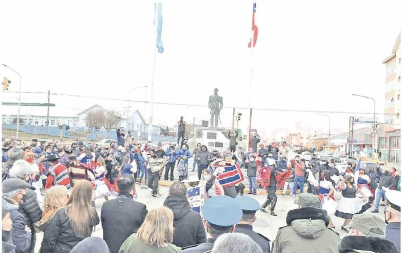
La celebración de nuestra Independencia Nacional en la ciudad de Río Grande, Tierra del Fuego.