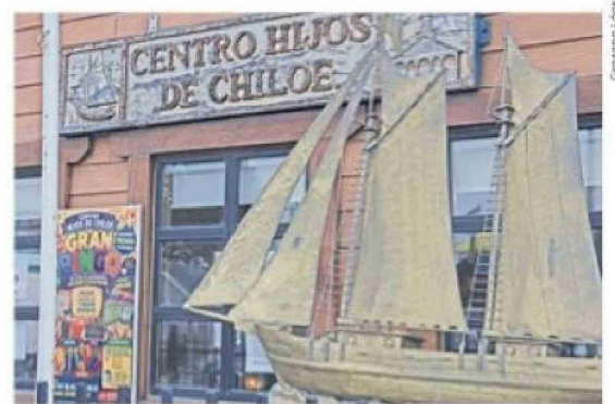
El Restaurante del Centro Hijos de Chiloé de Punta Arenas, en Avenida España.

dades chilenas en muchas ciudades del sur de la Patagonia argentina, formen grupos folclóricos integrados por descendientes chilenos y en algunas ocasiones hasta por los mismos argentinos, donde se cultivan cantos y danzas de su patria de origen, como el caso del Conjunto Folclórico del Centro Chileno de Río Gallegos, Estrellitas Australes, de la misma localidad, Archipiélago del Sur, de Ushuaia, Agrupación Los Copihues, de 28 de Noviembre, Tierra Huasa y Raíces y Hermandad, en Río Grande, etc.