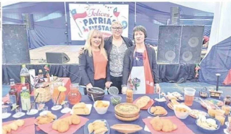
Cada 18 de septiembre la comunidad chilena establecida en la vecina ciudad de Río Gallegos, se une a la celebración de las Fiestas Patrias de Chile, disfrutando de la gastronomía, música y baile.

presencia de chilenos que chilenezaban las costumbres argentinas".