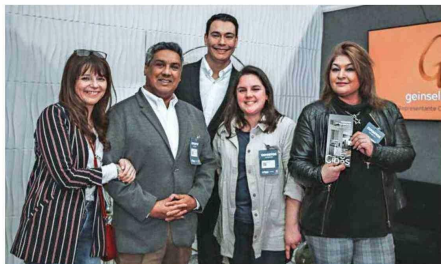
Un equipo de expertos acompaña de manera integral a los clientes de Geinse Lift.

Otra característica distintiva de los elevadores Cibes es que cuentan con certificación europea de un 95% de sus componentes reciclables y de eficiencia energética de tipo A, lo que los convierte en una elección verde y sostenible.