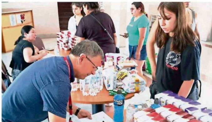
DESDE TEMPRANO, EQUIPOS DE DIDECO TRABAJARON JUNTO A VECINOS.