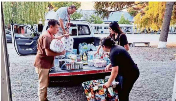
EL FLUJO CONSTANTE DE APORTES MARCÓ LA JORNADA Y DIO CUENTA DEL COMPROMISO DE LA COMUNIDAD.