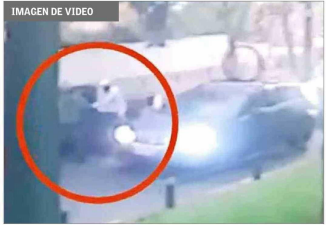
Empresario ferretero (84) fue secuestrado en barrio residencial San Miguel.

tras que en el caso de Estación se trata de dos chilenos y dos venezolanos. Tras la audiencia, el fiscal Tapia comentó tras la formalización respecto de los imputados "que luego de los alegatos, donde se expusieron los elementos probatorios, se acredita la participación en los delitos, la forma en como ocurrieron estos hechos, a través de los elementos exhibidos". Entre ellos, detalló, "imágenes de cámaras de seguridad, análisis de teléfono, posicionamiento de antenas, interceptaciones telefónicas, entre otros. Pero también respecto de algunos antecedentes entregados por testigos que fueron bastante útiles para poder dar con el lugar de cautiverio y poder rescatar, lo más importante, a la víctima". Y agregó que "luego de todos estos antecedentes se decretó la prisión preventiva para todos los imputados e internación provisoria (para el adolescente)". Preocupa ante la policía y expertos la eventual reactivación de este fenómeno, luego que las últimas estadísticas de la fiscalía dieran cuenta de que era un delito que iba a la baja, al menos en los primeros meses de este año, en comparación con 2025.