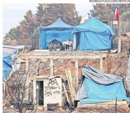
VECINOS BUSCAN RECUPERARSE TAMBIÉN EN LO EMOCIONAL.