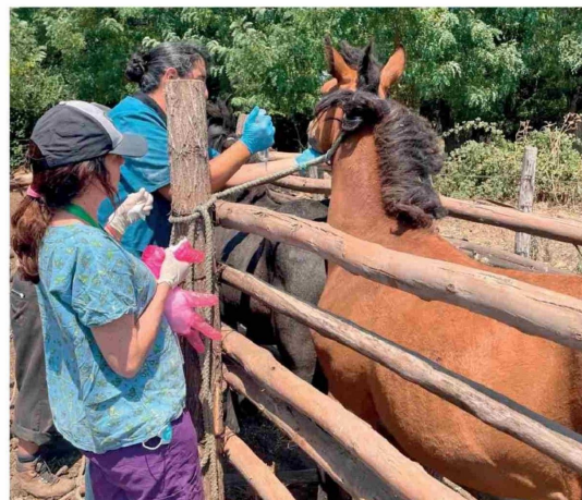
PROFESIONALES DE LA VETERINARIA municipal realizaron evaluaciones y curaciones a equinos afectados por el incendio en sectores rurales de Laja.

En el sector de Chorrillos, al menos 12 equinos fueron atendidos por veterinarios voluntarios provenientes de distintas comunas, con diagnósticos que incluyen quemaduras de carácter superficial y profundo, además de lesiones en extremidades asociadas al desplazamiento forzado en terrenos irregulares.