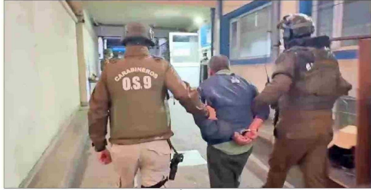
ATAQUES EN LA PRINCIPAL CARRETERA DEL PAÍS.— La indagatoria contra los miembros de la comunidad Temucú que vincula con atentados en la Ruta 5 Sur, entre otros ilícitos.