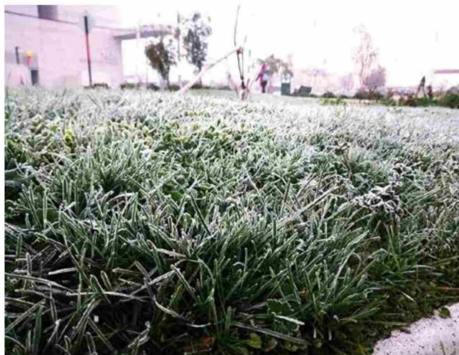
Ayer se vivieron heladas en el Maule Sur, el día más frío en lo que va de este otoño 2025.

Si se quiere reportar a personas en situación de calle, que requieran atención, el MDSF, puso a disposición el Fono Calle: 800 104 777 opción CERO.