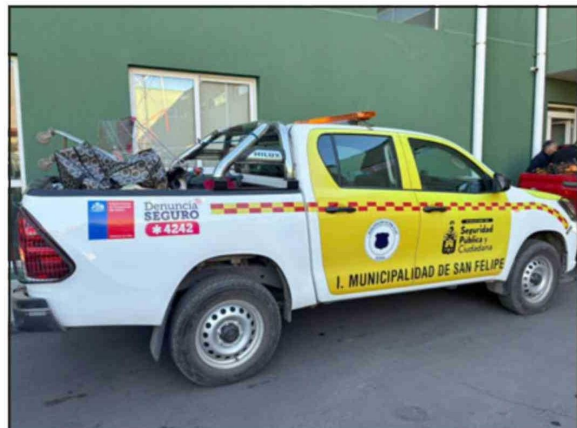
Diversos elementos se decomisaron