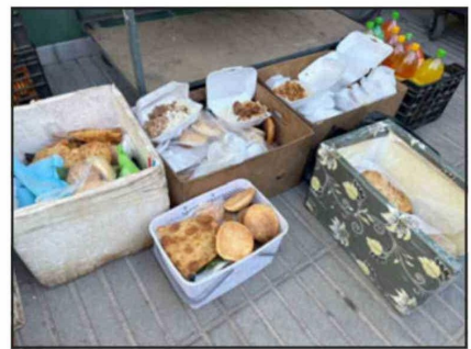
Estos son los alimentos incautados.