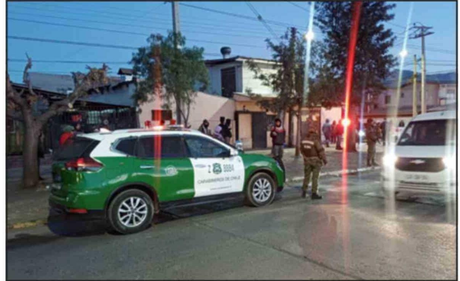
Un total de 14 detenidos tras nueva Ronda Impacto en San Felipe.