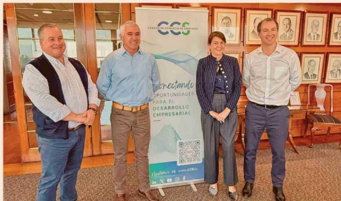
La integración con RedNegocios, también parte de la CCS, conecta los módulos de Abastecimiento Estratégico de Artikos con más de 8.000 proveedores evaluados y precalificados.