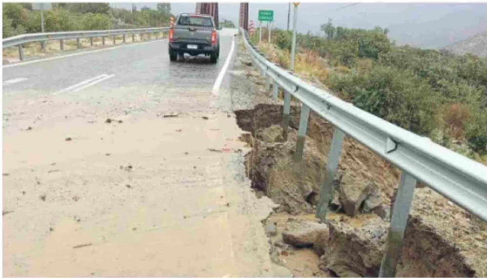
En Pichidanguí, con 130 mm, fue donde más se registraron lluvias durante el paso del sistema frontal.

lo en la región, de acuerdo al plan Invierno, hubo sobre 1.300 puntos identificados. Algunos, por ejemplo, en Paihuano donde había una quebrada que fue intervenida de manera directa por Vialidad anteriormente, y eso ha resistido. Hay quebradas en Canela, un de las cuales, bajó con mucho torrente y eso afectó el tránsito por lo que en su momento hubo un despliegue”.