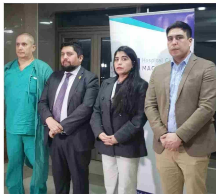
Algunas autoridades se hicieron presentes para acompañar a la familia del joven agredido.

Finalmente, los padres del joven agredido, quienes trabajan en Cerro Sombrero, fueron trasladados en helicóptero por Carabineros hasta Punta Arenas para acompañar a su hijo. En tanto, migos y compañeros del estudiante han iniciado cadenas de oración, mientras la comunidad educativa permanece en vilo por su recuperación.