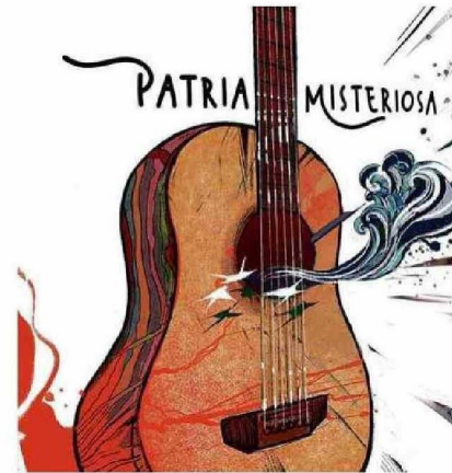
PATRIA MISTERIOSA (2024).

institucional a la música docta de nuestro país. Dada la magnitud de sus aportes, su figura es la de uno de los compositores imprescindibles en nuestra historia musical. Sociedad Bach es una institución que reúne a una serie de músicos, artistas, e intelectuales de diversas corrientes de pensamiento. Nos junta el amor por la música docta, pero principalmente la que ha nacido en Chile, sea esta actual o de otros tiempos".