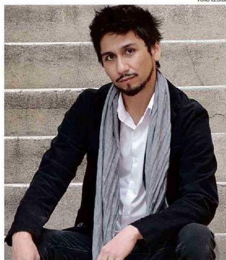
CHILENIDADES EN EL SIGLO XXI (2025).

Su cercanía con nuestra provincia tiene diferentes tonalidades. Desde 2024 es miembro de la Sociedad Bach de Chile, entidad creada por el compositor y vecino de Isla Negra, Domingo Santa Cruz Wilson, comenta: "Santa Cruz Wilson, fue el principal personaje que dio forma