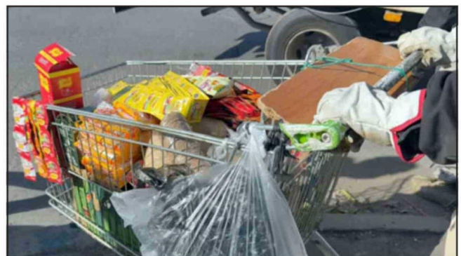
Once carros de supermercado fueron recuperados.

que no se consuman estos alimentos y que la regularización de aquellos que quisieran trabajar como corresponsales puedan realizarlo con todos los apoyos para evitar estas situaciones de decomiso y detenciones».