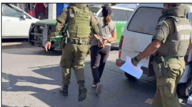
Un total de ocho personas fueron detenidas.

Se espera que estos operativos, y tal como han expresado las autoridades y dirigentes de la feria, se desarrollen de manera continua cada domingo cuando se lleva a cabo la feria de Diego de Almagro.