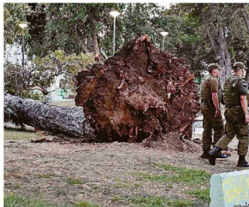
FUE EL 17 DE FEBRERO CUANDO OCURRIÓ LA TRAGEDIA.

tregue un informe sobre el mencionado bien nacional de uso público y su mantención, entre otras cosas.