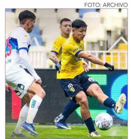
Copa de la Liga: UdeC empata con Católica en el Ester Roa

traspaso de dinero a las cuentas RUT del 80% de las familias más vulnerables de la población, según el Registro Social de Hogares (RSH). CIUDAD PÁG.6