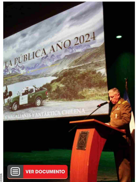
El general Marco Alvarado presentó la cuenta pública 2024 con avances en infraestructura, tecnología y despliegue territorial.

Entre los procedimientos relevantes mencionó el "Caso North Face", desarticulación