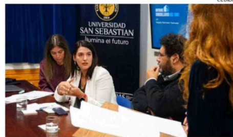
LA PRESENTACIÓN DEL INFORME TUVO LUGAR EN LA SEDE DE LA PATAGONIA (PUERTO MONTT) DE LA UNIVERSIDAD SAN SEBASTIÁN.

demoraría Puerto Varas en agotar su stock de proyectos detenidos, según revela el informe de la USS y Tinsa.