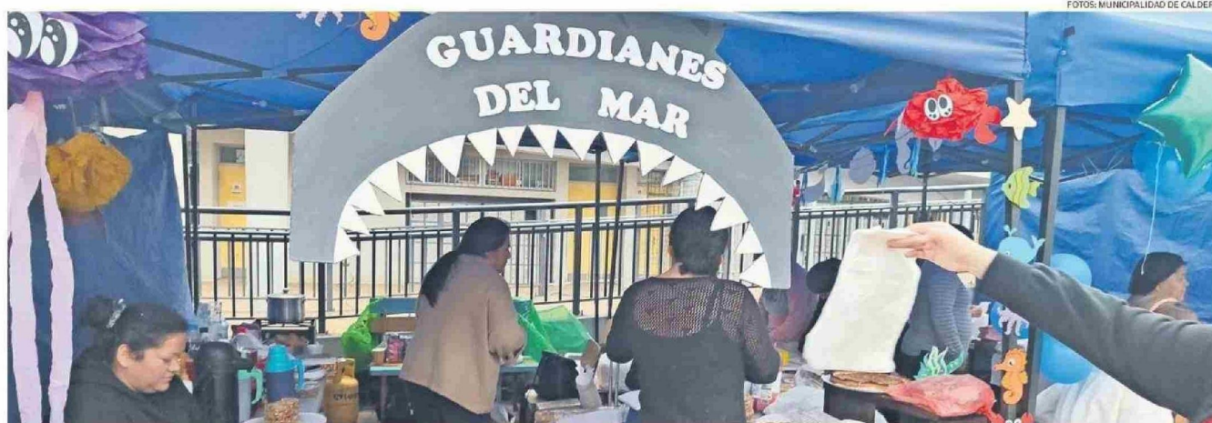
LA ACTIVIDAD SE REALIZÓ EN EL MARCO DE LAS INSTANCIAS PREPARADAS PARA DAR CIERRE AL MES DE MAYO.

Tiraje: 2.200 Lectoría: 6.600 Favorabilidad: No Definida