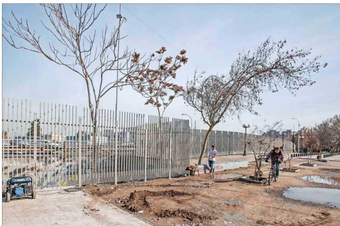
REJA. — La reja del parque cierra todo el sector dos y consideró una inversión de $840 millones.

"El comercio ilegal y las cocinerías y suciedad que estos dejan se han mantenido. El cierre no está cumpliendo su propósito de seguridad. Estéticamente