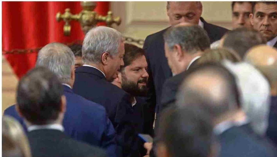
EL FUTURO JEFE DE ESTADO SE COMPROMETIÓ A QUE NO HABRÁ RETROCESOS EN MATERIA DE CIENCIAS DURANTE SU GOBIERNO.

siempre: vamos a sorprender, porque creemos que lo que están haciendo es muy relevante para el desarrollo y la calidad de vida de todos nuestros compatriotas".