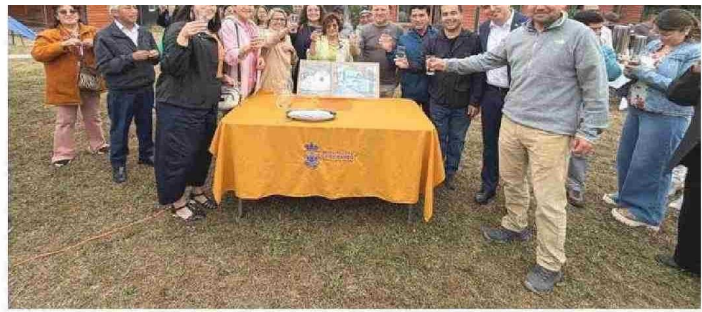
EN EL SECTOR DE PITRIUCO SE INAUGURÓ EL SERVICIO QUE ENTREGA AGUA POTABLE A UN TOTAL DE 193 FAMILIAS.

En tanto, la obra de Calcurrupe Bajo (financiada con $1.443 millones) considera la habilitación de un pozo profundo, sistemas de tratamiento y regulación y la construcción de un nuevo estanque semienterrado de 200 metros cúbicos, además de un sistema de bombas presurizadas y otro de tratamiento para la potabilización por medio de bombas dosificadoras. La red de distribución se extenderá por