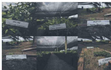
Los campesinos que viven en la Guardiania del Chiribiquete están trabajando en viveros para recuperar cultivos propios de la zona.