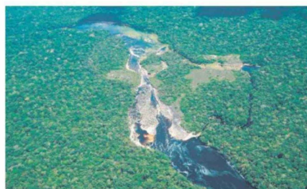
La Guardiania de Chiribiquete contribuirá a la conservación de la biodiversidad del PNN y de sus servicios ecosistémicos.

De acuerdo con Global Forest Watch, entre 2002 y 2024 el municipio perdió cerca de 99 000 hectáreas de bosque primario húmedo. Tras el Acuerdo de Paz, la deforestación aumentó de manera acelerada, pasando de 2 200 hectáreas en 2016 a 9 400 en 2017, y alcanzando su punto más alto en 2018 con 13 000.