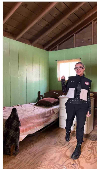
La habitación de Eleven.

De fondo, la casa de Joyce y Will Byers.