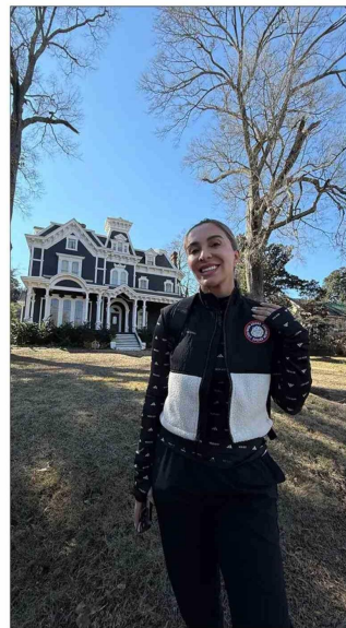
La casa de infancia de Vecna.