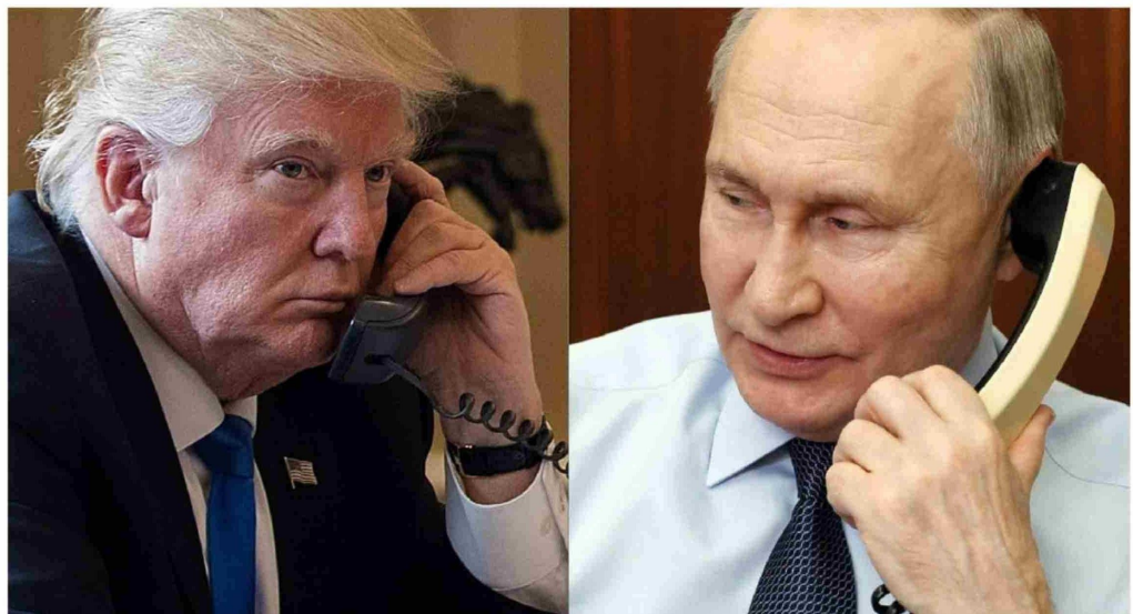
► Los presidentes Donald Trump y Vladimir Putin conversaron telefónicamente cerca de dos horas.

Sin embargo, Trump no pareció sacar mucho de la conversación, porque Putin continuó negándose a aceptar un alto el fuego incondicional de 30 días, que había sido el objetivo del llamado del republicano. El líder del Kremlin no dio señales de dar marcha