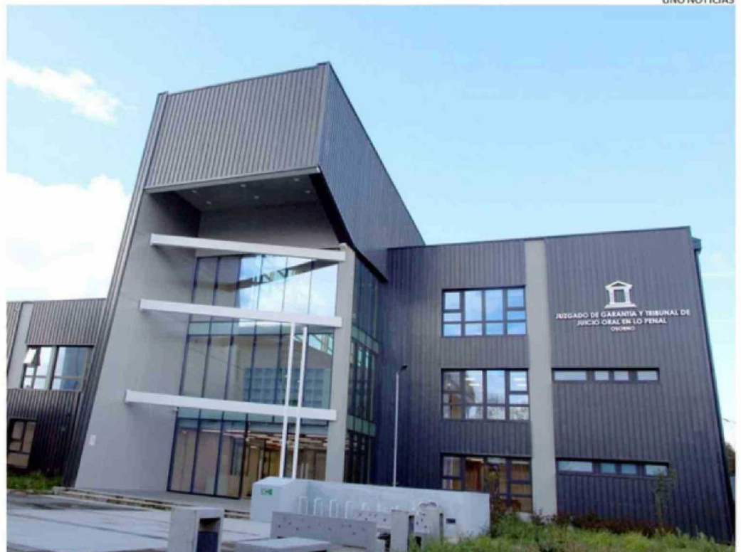
LA LECTURA DE SENTENCIA SE LLEVÓ A CABO AYER EN EL TRIBUNAL.

“Mediante la utilización de un fusil, el imputado disparó en la cabeza de la víctima, provocándole la muerte”.