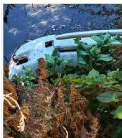
EL VALLE CON EL LLANO. AV. GABRIELA MI