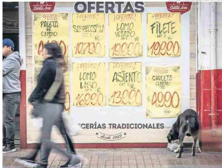
ATACAMA PRESENTA UNA BRECHA ENTRE LA POBREZA POR INGRESOS Y LA MULTIDIMENSIONAL, SEGÚN CASEN.